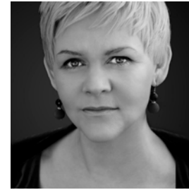
Barbara Bonney (Vorsitz)