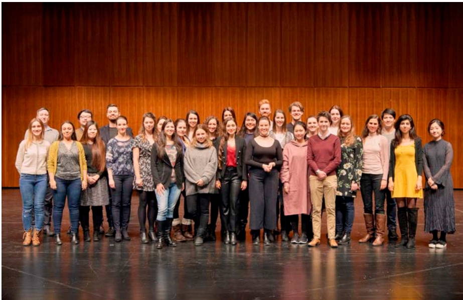
Teilnehmerinnen und Teilnehmer des 13. Internationalen Mozartwettbewerbes 2018, Sparte Gesang