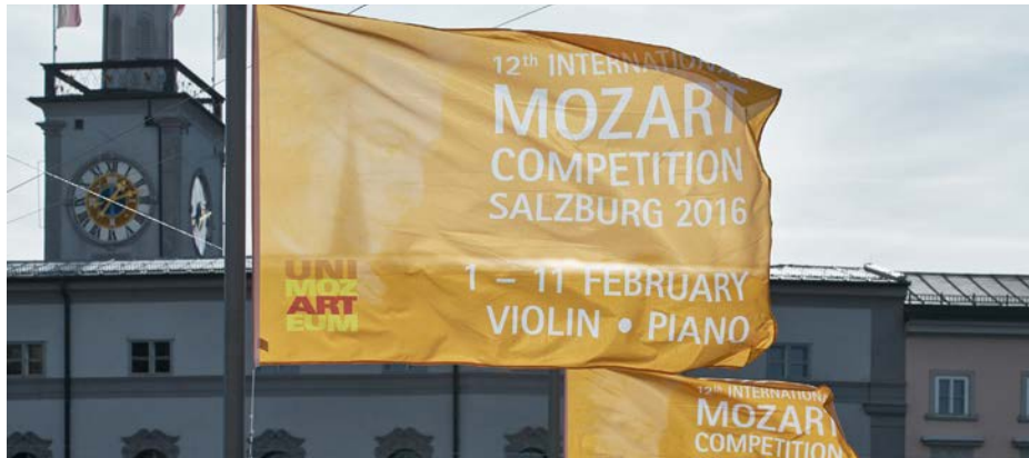
Wir gratulieren allen Teilnehmerinnen und Teilnehmern des 12. Internationalen Mozartwettbewerbes 2016