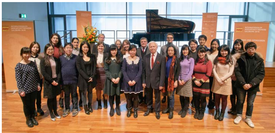
Teilnehmerinnen und Teilnehmer des Internationalen Mozartwettbewerbes 2016, Sparte Klavier